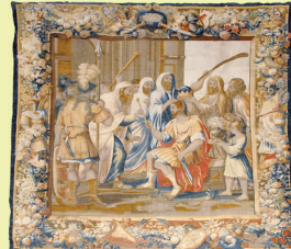
Rómulo coronado rey.

Se considera como fuente literaria principal de este conjunto la "iconología" de Cesare Ripa, a excepción del paño "La gloria de las musas estimuladas por la paz", que se conservó muchos años en la Sacristía de las Cabezas, que tiene su referencia principal en los relatos de las "Metamorfosis" de Ovidio.