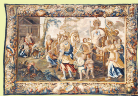
Pallas triunfante acompañada de las musas por el triunfo de las armas.

El deseo del Obispo era regalar la gran serie doble de 16 paños que había encargado hacer en Flandes y que por fin se acabaron en 1668, llegando a Sigüenza en torno a la fecha de su muerte. En su testamento lo especificó claramente, y en una nota del Inventario de Tesorería de 1624 vuelve a quedar señalada claramente la cuestión del regalo y llegada de estos paños a Sigüenza, pues se dice en ella que el Obispo Bravo de Salazar donó "una colgadura de tapicería de Flandes que se compara de 16 paños, los 8 de la Historia de Rómulo y Remo y los otros 8 de el Triunfo de las armas y las letras con el coro de las nueve musas, todas las colgaduras tienen figuras grandes y se pone en invierno en la Capilla Mayor, la regaló a esta Santa Iglesia el ilustrísimo A. Bravo".