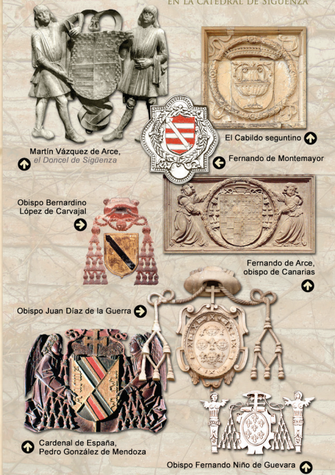
Martín Vázquez de Arce, el Dancel de Sigüenza