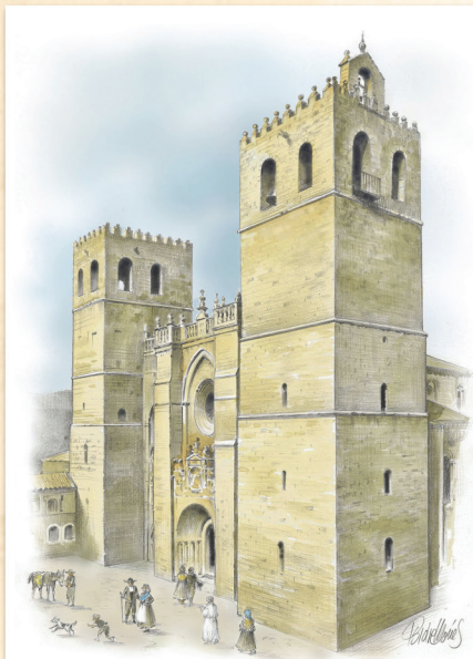
La catedral de Sigüenza, desde Poniente (dibujo original de Isidre Monés Pons para este libro)

En la obligada descripción de los elementos que destacan al exterior del templo, nos situamos en un principio ante la fachada principal, orientada al poniente. De aspecto imponente y militar, muestra un paramento central en el que surgen las tres puertas principales, correspondiéndose cada una de ellas con las respectivas naves del templo. La central es mayor que las laterales, y todas ellas, menos la del norte, sufrieron en el siglo XVIII mutilaciones